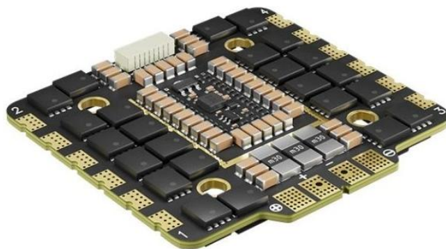
Obr.1. ESC 4in1 90A AM32

ESC 4in1 90A AM32 je elektronický regulátor otáček s konstrukcí 4 v 1, který podporuje rozsah vstupního napětí od 3 do 8S. Má schopnost zvládnout trvalý proud 90 A a špičkový proud 100 A, je vybaven mikrokontrolérem AT32F421K8U7 a pracuje s firmwarem označeným jako AM32. ESC podporuje různé protokoly, včetně DShot150, DShot300, DShot600, Multishot, ProShot, PWM a OneShot, s obousměrnou funkcí DShot.