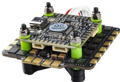
Rys.1. Pilotix F405 V3 3080 AM32 80A

Stack Pilotix F405 V3 80A to system zasilania o ekstremalnej wydajności, zaprojektowany z myślą o zastosowaniach FPV wymagających wysokiego napięcia (do 8S) i wysokiego natężenia prądu. Zawiera wszechstronny kontroler lotu F405 oraz potężny 4-w-1 regulator prędkości 80A z oprogramowaniem AM32. Ten Stack jest zoptymalizowany pod kątem dużych konstrukcji o rozmiarach od 5 do 10 cali, oferując zintegrowane strojenie przez Bluetooth oraz zaawansowane możliwości przełączania kamer.