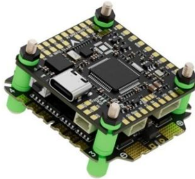
Rys.1. Pilotix F405 V3 ICM42688 AM32 65A

F405 V3 ICM42688 AM32 65A to kontroler lotu, który integruje mikrokontroler STM32F405 i obsługuje oprogramowanie PILOTIXF405V3, a także oprogramowanie Betaflight w celu zwiększenia możliwości operacyjnych. Posiada żyroskop ICM42688-P i zawiera wbudowany akcelerometr oraz magnetometr, zapewniając niezbędne funkcje wykrywania ruchu, a także integruje barometr SPL06 do pomiaru wysokości. Urządzenie działa w zakresie temperatury otoczenia od -20^{\circ}\text{C} do 40^{\circ}\text{C} i wymaga pasywnego chłodzenia przez naturalny przepływ powietrza, aby utrzymać optymalną wydajność. Dodatkowo ma kompaktowe wymiary, z wagą wynoszącą 25,4 gramów, co ułatwia łatwą integrację w różnych zastosowaniach FPV.