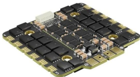
Мал.1. ESC 4in1 80A AM32 8S

ESC 4in1 80A AM32 8S — це електронний регулятор швидкості з чотирма в одному, призначений для FPV-додатків. Він має постійний струм 80A і пікову потужність 100A, підтримує входні напруги від 3 до 8S. Пристрій обладнаний мікроконтролером AT32F421K8U7 та використовує прошивку AM32, що дозволяє використовувати кілька протоколів, включаючи DShot150, DShot300, DShot600, Multishot, OneShot, ProShot та PWM.