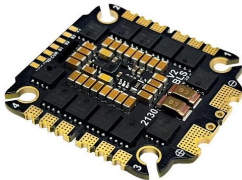
Fig.1. ESC 4in1 BLS 75A 6S

Le contrôleur de vitesse électronique ESC 4in1 BLS 75A 6S est un contrôleur quatre-en-un conçu pour des applications FPV. Il prend en charge une plage de tension d'entrée de 3 à 8S, délivrant un courant continu de 75A avec une capacité de courant de crête de 85A. Cet ESC est équipé du microcontrôleur EFM8BB51F16G et fonctionne avec le firmware Blujay, offrant divers protocoles incluant DShot150, DShot300, DShot600, Multishot, OneShot, ProShot et PWM. Il inclut un support de télémétrie pour le courant, la tension, la température et les RPM, avec des exigences de refroidissement passif pour des conditions de fonctionnement optimales.