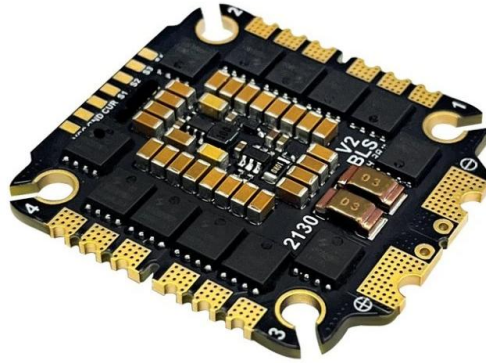
Fig.1. ESC 4in1 BLS 75A 6S

El ESC 4en1 BLS 75A 6S es un controlador de velocidad electrónico de cuatro en uno diseñado para aplicaciones FPV. Soporta un rango de voltaje de entrada de 3 a 8S, entregando una corriente continua de 75A con una capacidad de corriente pico de 85A. Este ESC está equipado con el microcontrolador EFM8BB51F16G y opera utilizando el firmware Blujay, que cuenta con varios protocolos incluyendo DShot150, DShot300, DShot600, Multishot, OneShot, ProShot y PWM. Incluye soporte de telemetría para corriente, voltaje, temperatura y RPM, con requisitos de enfriamiento pasivo para condiciones de operación óptimas.