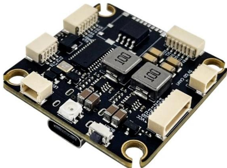
Fig.1. Pilotix F405 V3 ICM42688

Il Pilotix F405 V3 Stack è un sistema di volo ad alte prestazioni progettato per droni FPV da 3 a 8S. È dotato di un Controllore di volo F405 equipaggiato con il giroscopio ad alta velocità ICM42688 e di un robusto ESC da 80A con firmware AM32. Questo Stack è progettato per garantire estrema affidabilità in applicazioni ad alta corrente, offrendo Bluetooth integrato per la regolazione wireless, commutazione tra doppia telecamera e un rail di alimentazione dedicato da 9V per sistemi video digitali.